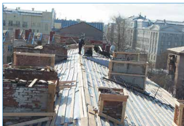
Омск, ул. Маяковского, 15

В отличие от должников, собственники, в чьих домах капитальный ремонт запланирован на текущий год, получают в квитанции хорошую новость – предложение Регионального оператора о проведении работ. Напомним, что из-за изменений, внесенных в Жилищный кодекс в декабре 2013 года, реализация региональной программы в Омской области (а именно оплата взносов и старт работ) началась только в октябре 2014 года, соответственно ряд объектов 2014 года перешел на 2015-й. Собственникам, в чьих домах капремонт запланирован в 2015 году, в конце прошлого года были направлены предложения Регионального оператора, больше 100 из них даже получили свои согласования.