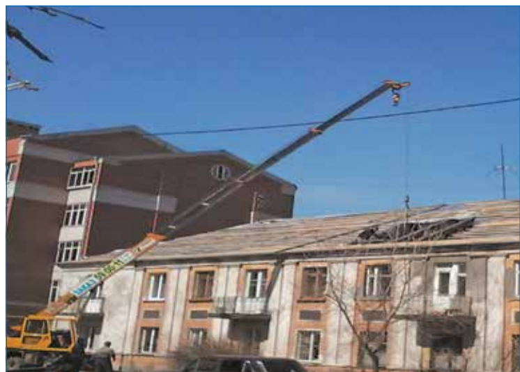
Омск, ул. Вокзальная, 12